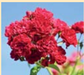
Numéro 1 des grimpantes.