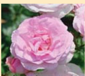
Première rayon parfum.